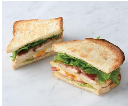
Club House Sandwich クラブハウスサンド

原材料に小麦・乳成分・豚肉を含む Allergen advice: Wheat, Milk, Pork