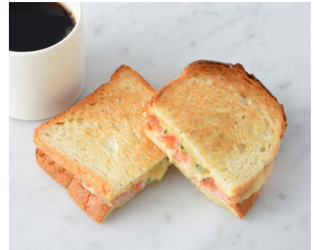
Melt Sandwich メルトサンド

原材料に小麦・卵・乳成分・大豆・豚肉・鶏肉・りんご・ごまを含む Allergen advice: Wheat, Egg, Milk, Soybean, Pork, Chicken, Apple, Sesame