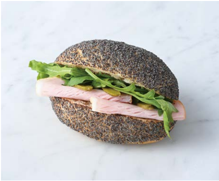
Loin Ham & Arugula Sandwich ロースハムとルッコラのサンド

原材料に小麦・乳成分・大豆・豚肉・りんご・オレンジ・ごまを含む(ブロッコリーとカリフラワーのサラダは除く) Allergen advice: Wheat, Milk, Soybean, Pork, Apple, Orange, Sesame ブロッコリーとカリフラワーのサラダ: 原材料に卵・乳成分・豚肉・りんごを含む Allergen advice: Egg, Milk, Pork, Apple