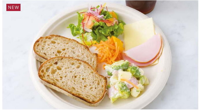
Deli Set to Enjoy with Bread (Broccoli & Cauliflower Salad) パンと楽しむデリプレート(ブロッコリーとカリフラワーのサラダ)

原材料に小麦・乳成分・大豆・豚肉・りんご・オレンジ・ごまを含む(ちょうちょの Pasta サラダは除く) Allergen advice: Wheat, Milk, Soybean, Pork, Apple, Orange, Sesame ちょうちょの Pasta サラダ: 原材料に小麦・卵・大豆・さば・えび・りんご・ごまを含む Allergen advice: Wheat, Egg, Soybean, Mackerel, Shrimp, Apple, Sesame