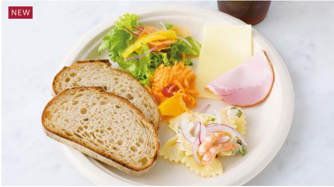
Deli Set to Enjoy with Bread (Butterfly Pasta Salad) パンと楽しむデリプレート(ちょうちょの Pasta サラダ)