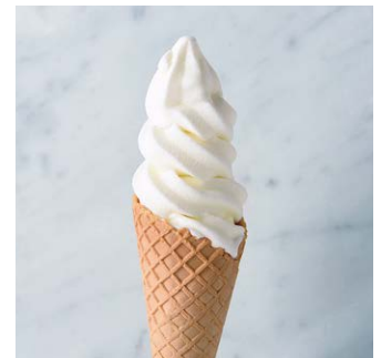
Soft-Serve Ice Cream ミルクソフト ¥440 税込

チョコレートケーキにミルクソフトとエスプレッソ。グラノーラの食感がアクセントになっています。 Chocolate cake with soft-serve ice cream and espresso. Accented with texture of granola. 原材料に小麦・卵・乳成分・大豆・くるみを含む Allergen advice: Wheat, Egg, Milk, Soybean, Walnut