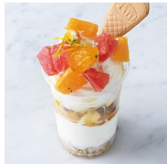
Citrus & Honey Parfait シトラスフルーツと はちみつのパフェ ¥780 税込

オレンジリキュールを効かせたホイップで仕上げた香りよいココアです。※トッピングのクリームにお酒を使用しています。 Fragrant cocoa topped with whipped cream with orange liqueur. ※Contains alcohol in the cream topping.