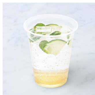
Elderflower Soda エルダーフラワーソーダ ¥682 税込

Non-alcoholic drink with beautiful, vibrant yellow color like a mimosa. Made with non-alcoholic sparkling wine.