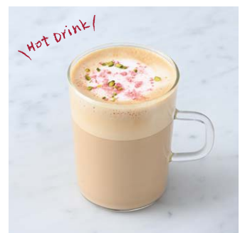
Spring Latte 春色ラテ ¥550 税込

抹茶の風味とミルクのやさしい味わい。オレンジリキュールのホイップで仕上げました。※トッピングのクリームにお酒を使用しています。 Flavor of matcha and gentle taste of milk. Finished with whipped cream containing orange liqueur. ※Contains alcohol in the cream topping.