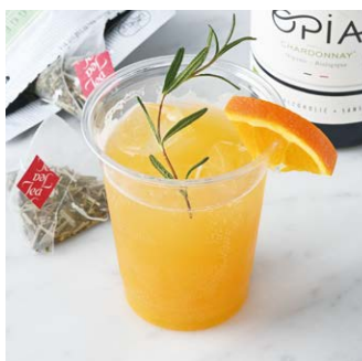
Mimosa Sparkling ミモザのスパークリング ¥660 税込

ミモザのように鮮やかな黄色が美しい、ノンアルコールドリンクです。※ノンアルコールのスパークリングワインを使用しています。