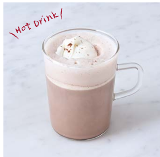
Hot Cocoa ホットココア ¥561 税込

こだわりのラテにさくらランチとピスタチオをトッピング。春らしい味わいをお楽しみください。 Our special latte topped with sakura crunch and pistachio. Enjoy the springlike flavor.