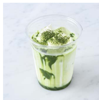
Iced Matcha Latte アイス抹茶ラテ ¥561 税込

マスカットに似た爽やかな香り。ライムですっきりと仕上げました。 Refreshing elderflower soda with a touch of lime. Similar flavor to muscat.