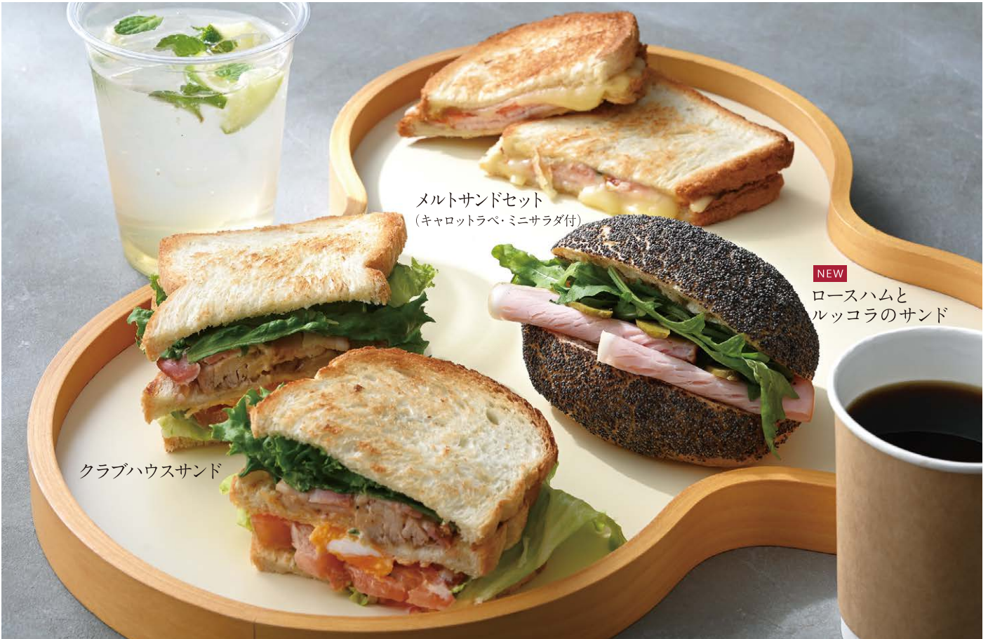
メルトサンドセット (キャロットラペ・ミニサラダ付)